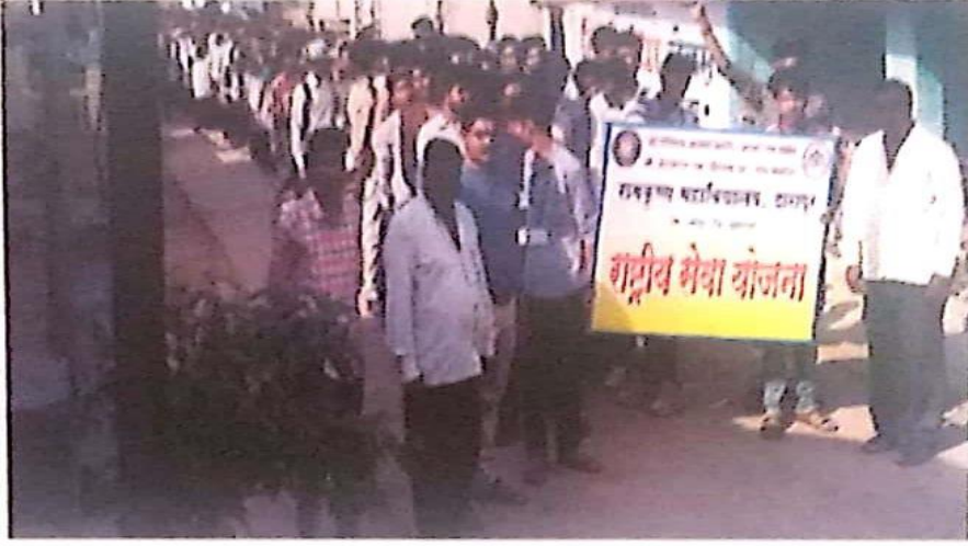
एड्स जनजागृती रॅली 01 / 12 / 2019