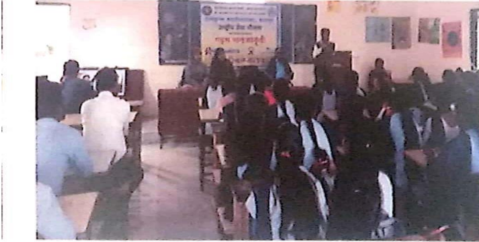
एड्स जनजागृती कार्यशाळा 08 / 01 / 2020

[Signature] PRINCIPAL Ramkrushna MV, Darapur Tq. Daryapur, Dist. Amravati